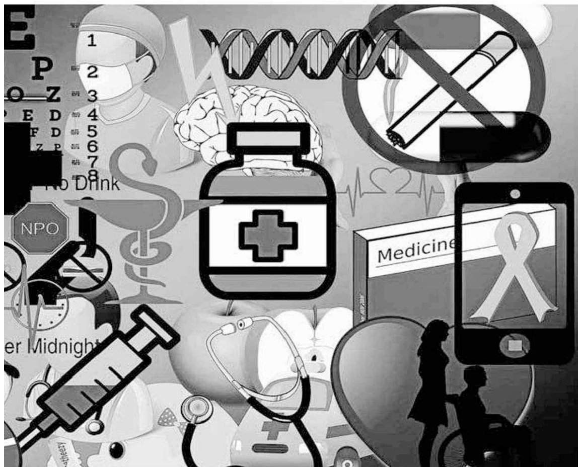
za del sistema sanitario vasco debe apoyarse en todos los sectores que conforman su cadena de valor.

que Health Cluster, su directora se suma a las palabras de Anitua y apoya el negacionismo que ha existido en todo lo relacionado con el inicio de la pandemia. Coincide con Vidorreta en que habrá que analizar lo ocurrido con objetividad trascurrido un tiempo, ya que ahora mismo seguimos inmersos dentro de una crisis sanitaria, con el virus vivo aún, y lo prioritario es salir de ella.